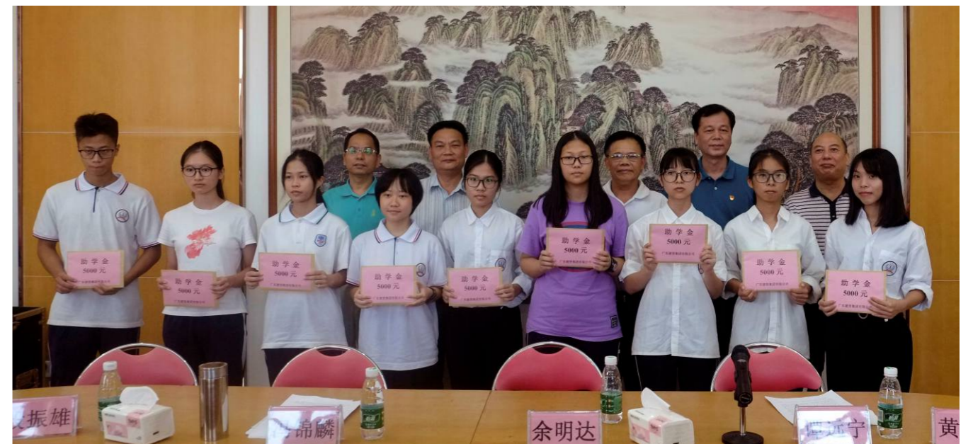
第四届广东骏贤集团有限公司助学金颁发仪式