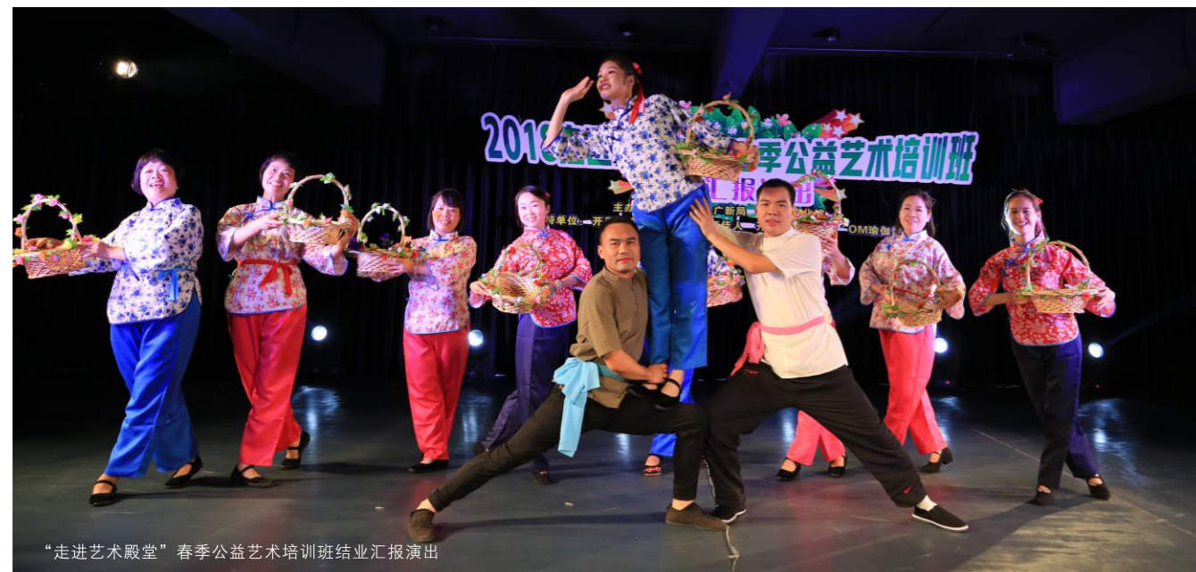
“走进艺术殿堂”春季公益艺术培训班结业汇报演出

“走进艺术殿堂”春季公益艺术培训班，是开平市文化馆打造的文化品牌活动，是开平市文化部门坚持“文化惠民”的真招实举。今年4-6月，这一公益文化品牌活动又如期举办，为开平“城市文明”添砖加瓦。