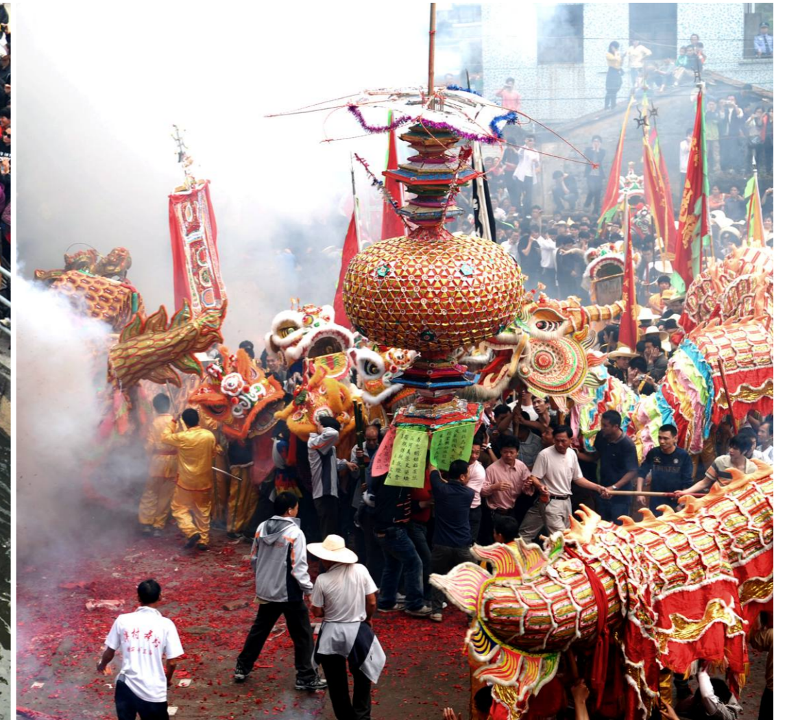
国家级非物质文化遗产“洋村灯会”活动盛况