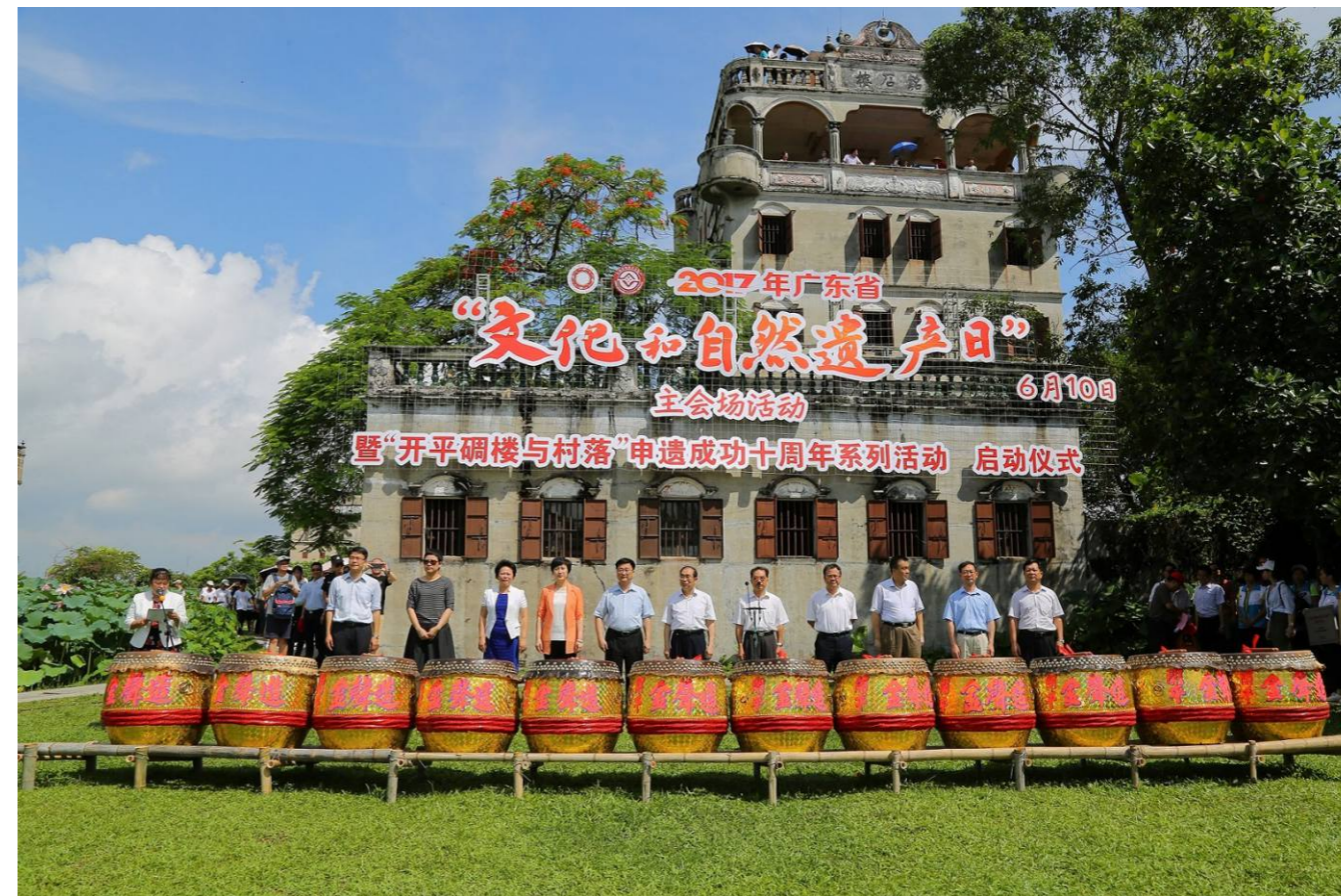
2017年6月，开平市成功承办了广东省“文化和自然遗产日”主会场活动暨“开平碉楼与村落”申遗成功十周年系列活动。