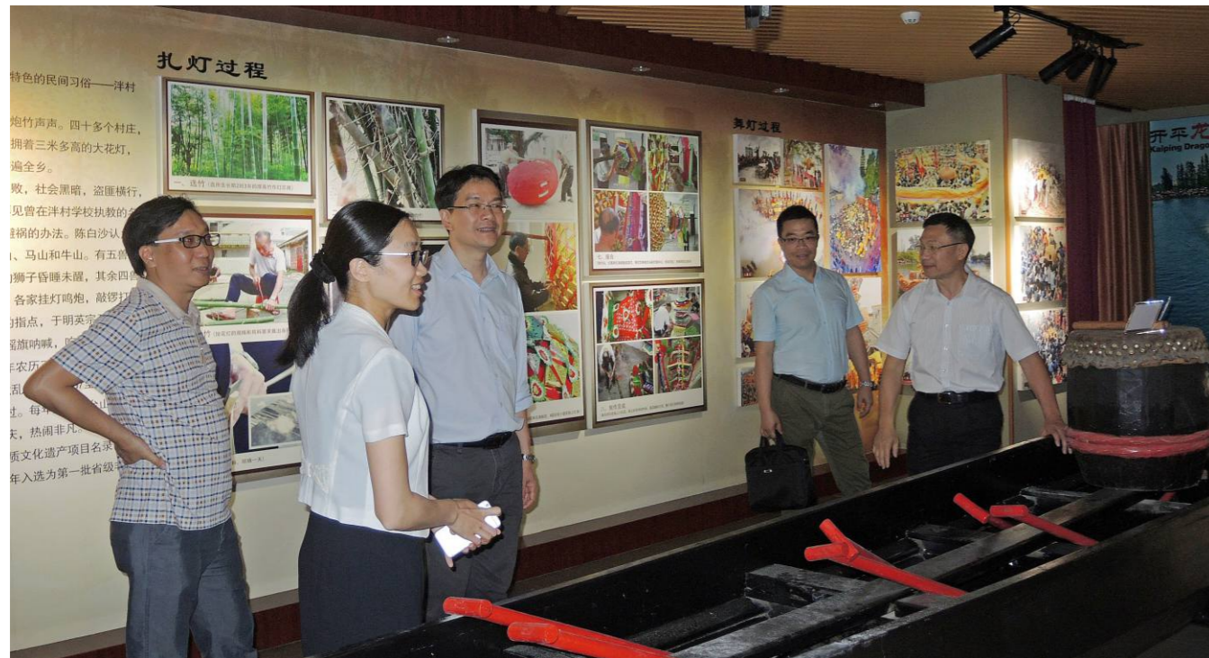
开平市委书记庞正华调研指导非遗保护工作