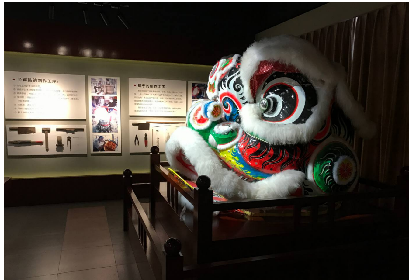
开平市非物质文化遗产展示馆内省级非遗项目“金声狮鼓制作工艺”展示区