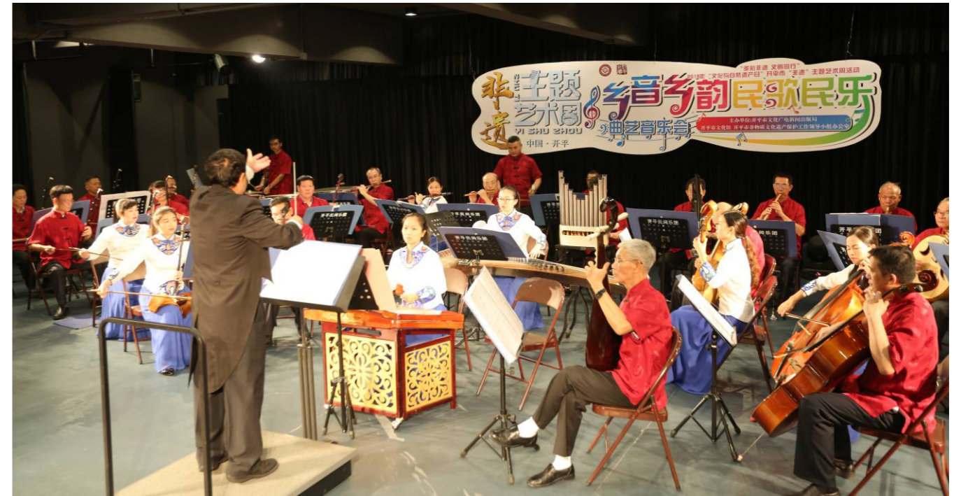
“乡音乡韵”民歌民乐曲艺音乐会