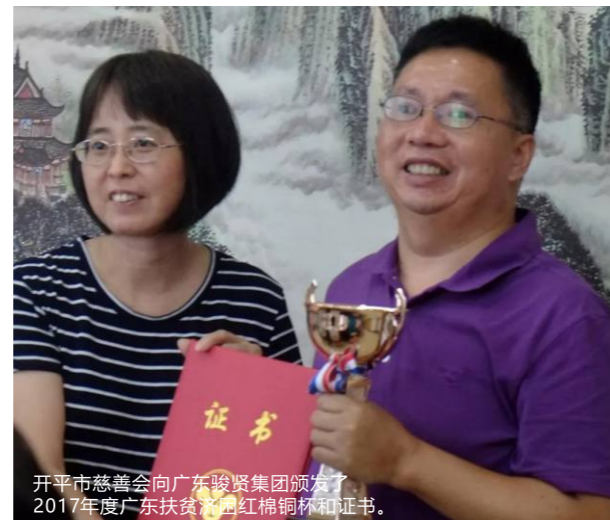
开平市慈善会向广东骏贤集团颁发了2017年度广东扶贫济困红棉铜杯和证书。