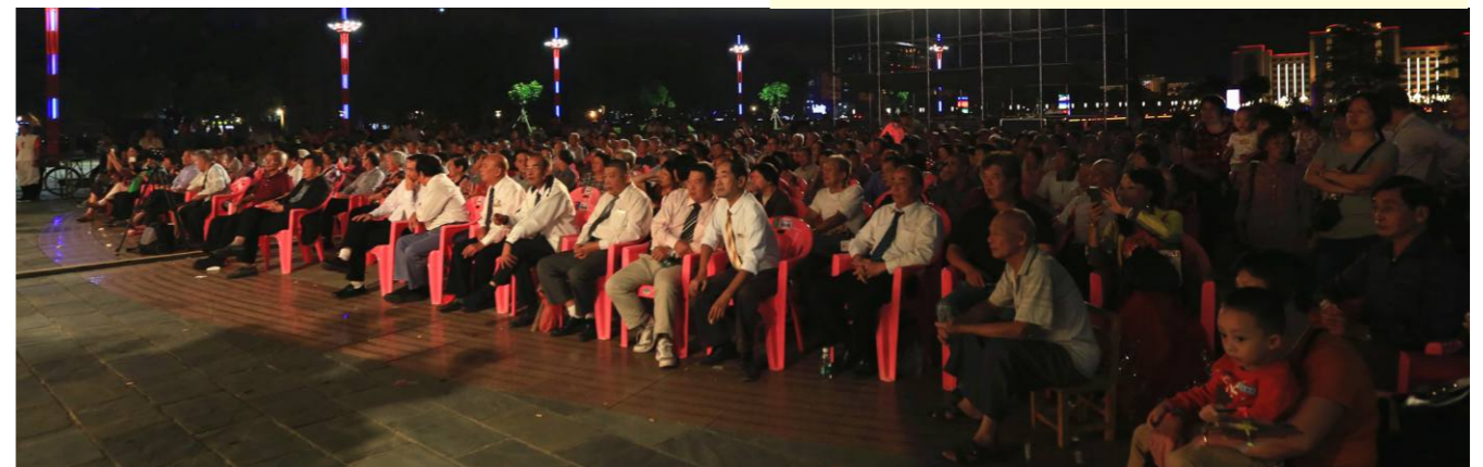
“金秋曲艺敬老活动周”深受群众欢迎，每晚演出，观众如潮