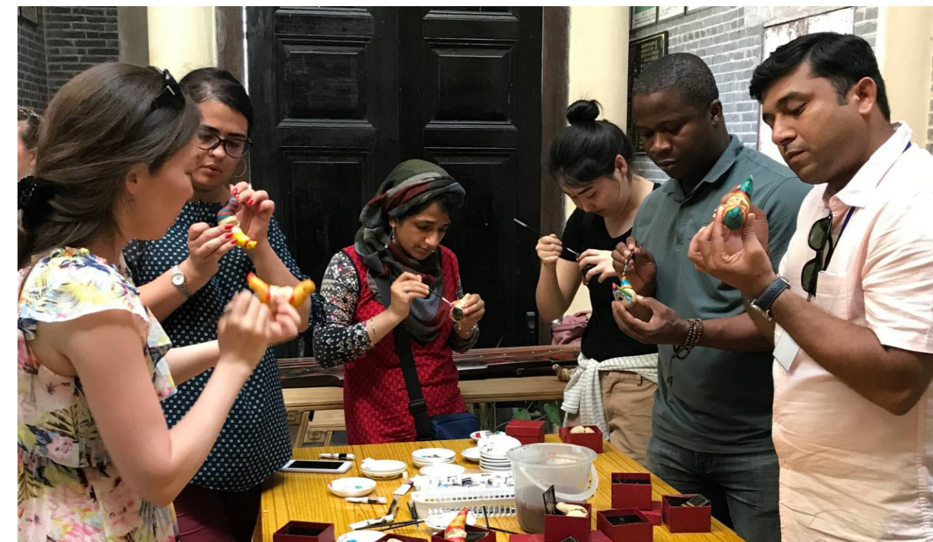
国际友人参与镇濠泥鸡彩绘活动

三是加强非遗特色小镇建设。深入挖掘镇（街）非遗文化资源，打造“一镇一非遗特色”。比如：马冈镇的马冈鹅、马冈竹器及马冈濠粉，金鸡镇的开平灰塑，水口镇的泮村灯会，长沙街道楼冈的网墟、赤坎镇的舞火龙、百合镇的舞草龙等，加大镇级非遗保护工作力度。