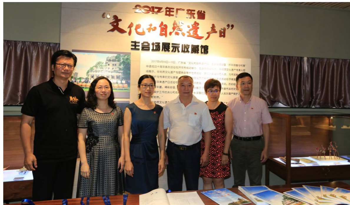
2017年“文化与自然遗产日”主会场展示收藏馆开馆揭幕仪式