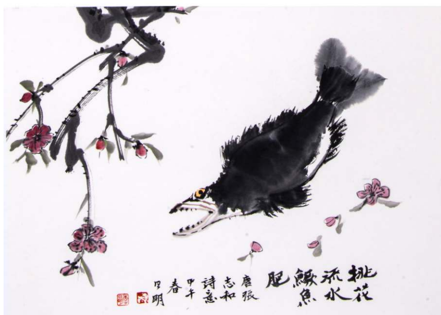
国画《花鸟小品》·李日明作