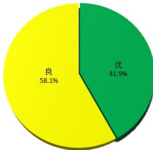
图1 1月江门市空气质量类别分布

1月，江门市环境空气质量同比持续改善，综合指数同比改善31.5%；空气质量优良天数比例为100%，同比改善12.9个百分点。评价空气质量六项污染物指标平均浓度均达到国家环境空气质量二级标准要求，且同比均大幅改善，其中PM 2.5 平均浓度为27微克/立方米，同比改善25.0%；PM 10 平均浓度为44微克/立方米，同比改善26.7%；SO 2 平均浓度为6微克/立方米，同比改善14.3%；NO 2 平均浓度为25微克/立方米，同比改善50.0%；CO平均浓度为0.8毫克/立方米，同比改善33.3%；O 3 -8h平均浓度为108微克/立方米，同比改善17.6%（详见附表1）。优良天数比例全省排名为并列第5位，珠三角9市排名为并列第3位。